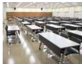
6階の多目的ホールは最大270名が着席可能

ケータリング業者の紹介や利用条件等については、業務管理課 ☎0466-29-3789 までお問い合わせください。