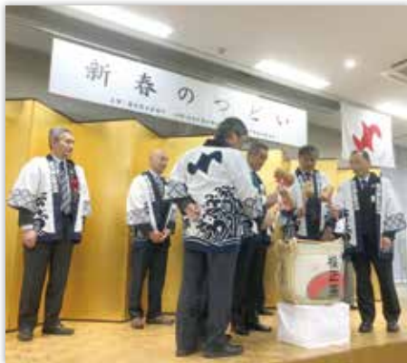
威勢よく鏡開きが行われた

な分野のネットワークを最大限活用して、中小企業が直面する諸課題克服に向けた取り組みを進めたい。「有って良かった！無くては困る商工会議所」を実現したい」と意気込みを示した。 このあと、鏡開きが威勢よく行われ、地域経済の発展に向けて前進していく一年となることを願い、参加者全員で乾杯を行った。